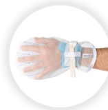
MITTY AIR PREMIUM Handschuh mit weichem Armband und Fingerseparatoren