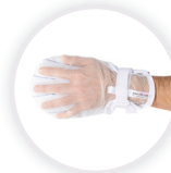
MITTY AIR BASIC Handschuh mit Netz- und Fingerseparatoren