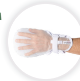
MITTY AIR Handschuh mit Netz und doppeltem Klettverschluss