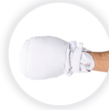
MITTY SECURE Doppelt gepolsterter Handschuh mit doppeltem Klettverschluss