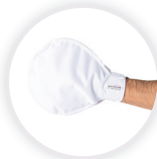
MITTY THERAPY Therapiehandschuh mit Styroporperlen