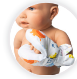
MITTY MINI Handschuh mit Inspektionsöffnung