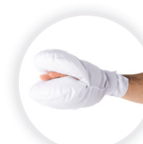
MITTY CARE Handschuh mit Inspektionsöffnung