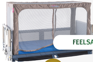
FEELSAFE GO ZELTBETT

FeelSafe Go, Fallsturzmatte, Antirutschsocken